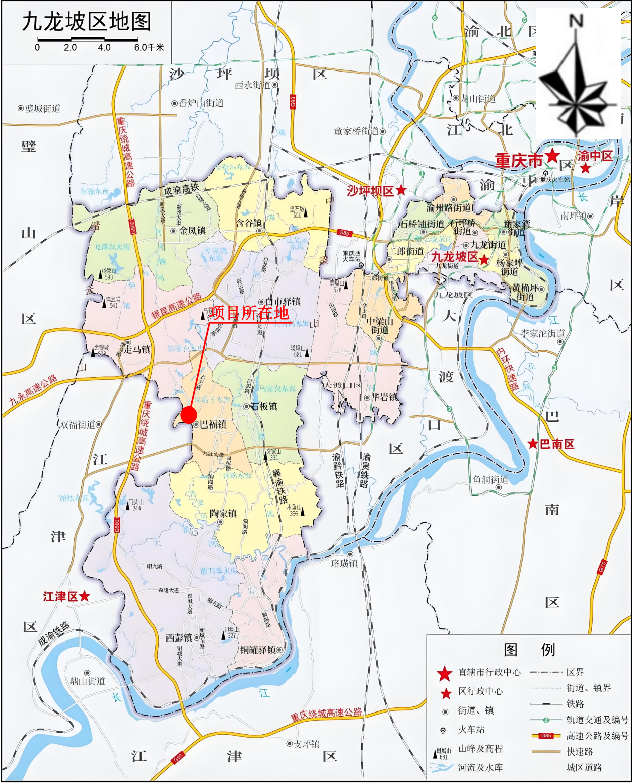
附图 1 本项目地理位置示意图