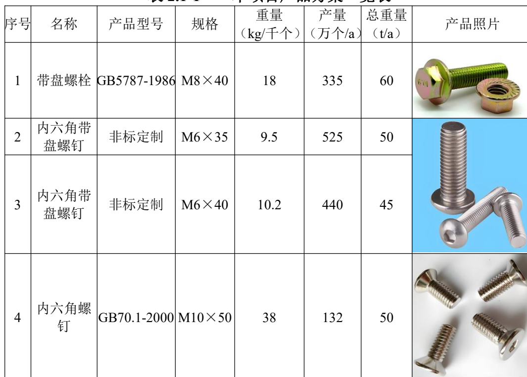
表 2.1-1 本项目产品方案一览表

注：本项目产品规格较多，故本次评价仅给出典型产品规格，并以典型产品核算原辅材料用量。